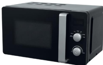
Modell: MPM-20-KMG-03 Mikrohullámú sütő