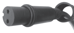
fig. 2. / 2. ábra / obraz 2. / Figura 2. / 2. skica / 2. skica / obraz 2.