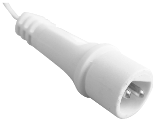
fig. 1. / 1. ábra / obraz 1. / Figura 1. / 1. skica / obraz 1.