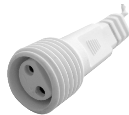
fig. 2. / 2. ábra / obraz 2. / Figura 2. / 2. skica / obraz 2.